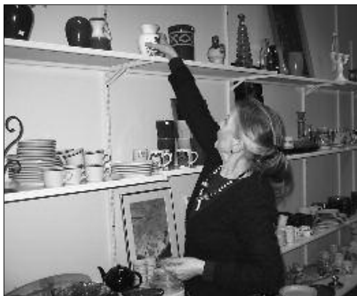
Lilly ordner i hyllene

Som en kuriositet kan nevnes at NMS-Gjenbruk i Sola fikk kommunens miljøvernpris for 2007. Tildelingen begrunnes med den store miljømessige gevinst som ligger i å ta vare på brukte gjenstander til en rimelig penge.