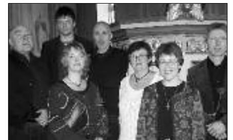
Medlemmene av Klinga menighetsråd.