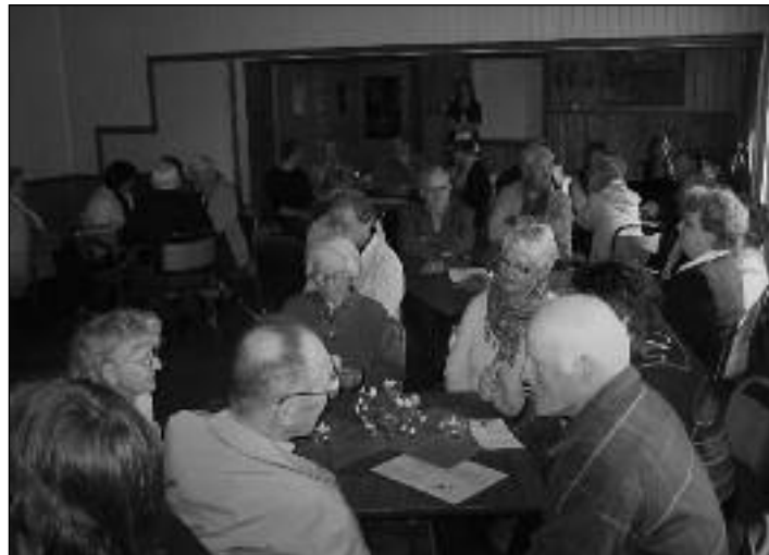
To ganger i året feires gudstjeneste i Botnan. Kr. Himmelfartsdag og 2. søndag i advent. Da møter det mange opp, ikke bare fra Botnan, men også fra Namsos og Vemundvik.