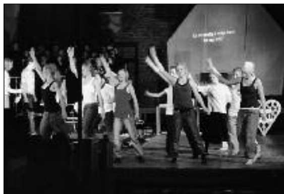
Årets musikal ble den siste i en lang rekke konfirmantmusikaler i Namsos.

Tekst: Gunn Ågot Leite.